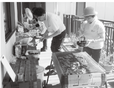
上手に焼けますように