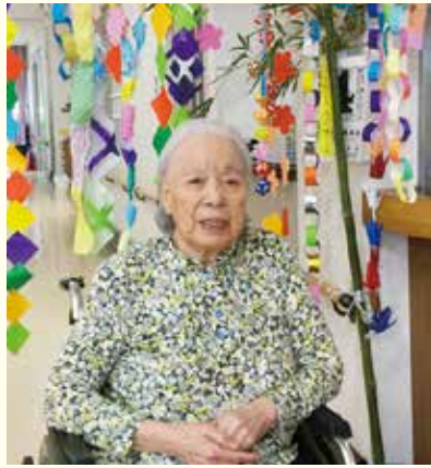
たくさん作れたよ