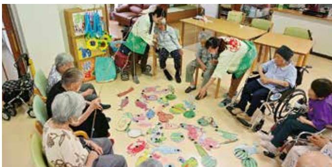
ねらって! あわせて! 大漁ゲット!