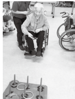
もうちょっと近づけてほしい