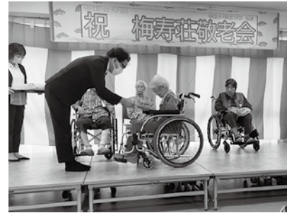
施設長より記念品贈呈