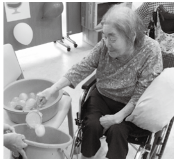
手のかなわんちゃんな～