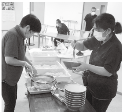
ラーメンはいかがですか