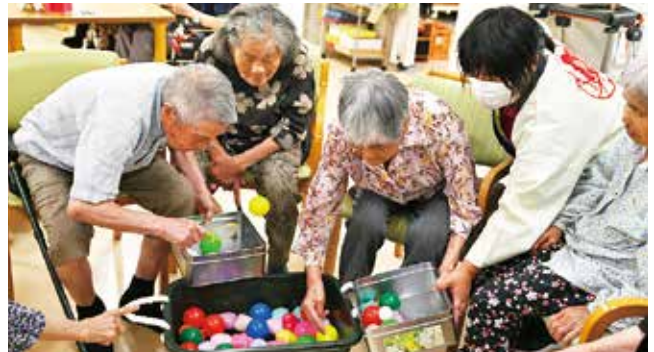
競争となれば「負けんぞ」

当日は、お手製の装飾で賑やかに飾り付けられた事業所内で、久しぶりのゲーム大会に張りきった、ご利用者の皆さんの熱気がムンムン。あちらこちらで笑い声や、「あらー」と悔しそうな声。30分という時間があっという間でした。 また、ゲームの後は、冷たいかき氷を「久しぶりで、うまか〜。」と喜んで召し上がっていました。