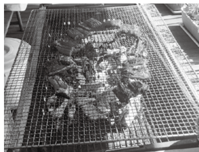
美味しそうな匂いです