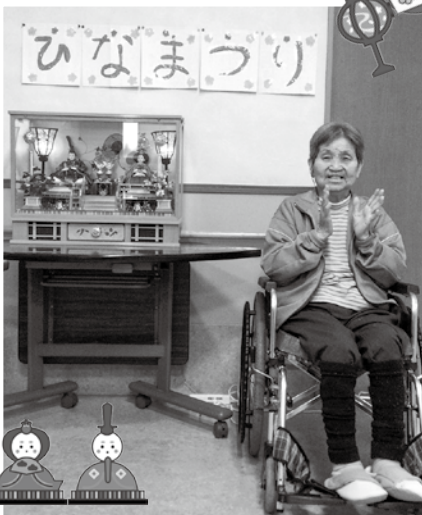
ひな人形の前でパシャリ

3月3日はひな祭り。今年は、ケースのひな人形を出して飾り、毎日眺めて過ごされている方もいらつしやいました。ユニットは現在、入居者様で女性が13名と、職員も女性が多いです。みんな集まってお雛様を前に歌を唄いました。談笑した後は、感染症予防のため、それぞれの棟に分かれて、サンドウィッチや甘酒、水ようかん、フルーチェなど作ったものを、おやつとして提供し、食べていただきました。好きなものを選び、「お雛さんの綺麗かね」と話ながら「美味しいね」と食べておられました。感染症が落ちつきつありますので、今年度はユニット全体での行事や、梅寿荘全体での行事もできることを願っております。