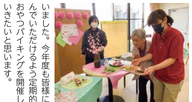
どれにしようかな?

い方もいらっしかったです。鬼が登場すると皆元気よく「鬼は外!福は内!」とボールを投げておられました。その後はおやつで甘納豆を食べ、「久しぶりに食べた〜うまか