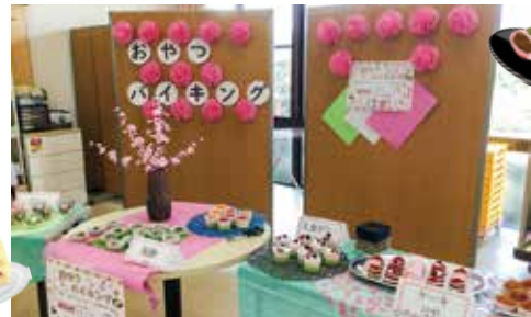
甘い香りがいっぱい

3月6日にひな祭りおやつバイキングを開催しました。春も近づき、ひな祭りの雰囲気桃色や赤色のケーキ、ムースやゼリー等、華やかなおやつがずらりと並びました。端から順にメニューを見て「いっぱいあって選びくらん」と話される方や「全部食べたか」と意気込む方など様々でしたが、皆さん楽しそうに選んでおられました。