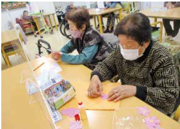
できあがりを楽しみ！