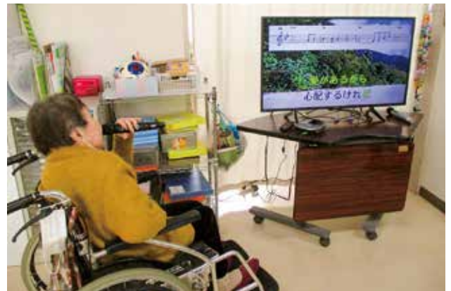
いい声でてるかしら？