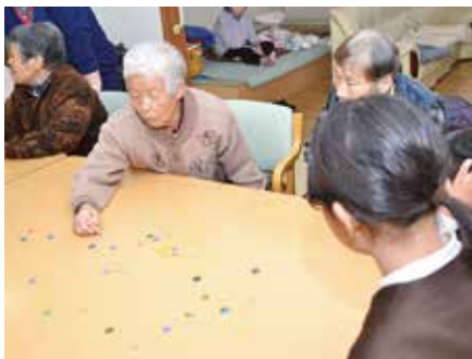
懐かしいおはじき遊び

今回も施設にご訪問いただいた団体様等をご紹介します。秋に開催しました文化祭においては和貴保育園、栖本小学校、栖本中学校、地元フラダンスクラブの方々にステージイベントを盛り上げてもらうとともに天草拓心高校、天草高校倉岳校の生徒の方々はボランティアスタッフとしてご協力いただきました。また、12月には栖本小学校4年生との交流事業や和貴保育園の踊り訪問に来荘していただき、利用者の方とても喜ばれていました。ご協力いただきました皆様、お世話になりました。