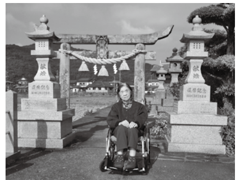
神社の入り口で記念撮影

ユニットでは、12月生まれの利用者の方の誕生日サプライズというところで、ご本人様に事前に行きたい場所や食べたい物の聞き取りをして計画を立てました。 誕生日サプライズの当日は、秋晴れのカラッとした暖かい天候でした。まずは、天草のパワースポットの1つである栖本町のイゲ神様へ参拝に行きました。境内の中には、お守り（合格、交通安全等）を販売する珍しい自動販売機があり、入居者の方も職員も大変驚きました。 ご神前に座わると、鈴をそつと鳴らし、何度も何度も合掌と礼をして、ご家族の健康、ご多幸をお願いされていました。 ちょうどお腹も空いた頃、昼食は味千ラーメンに行きチャンポンを注文されました。テーブルに運ばれたチャンポンを見て「こんなに食べきらんかもしれない。あんたも一緒に食べてちょうだい」と言われていましたが、いざ食べ始めるとペロリと完食をされて「食べてしもたな、美味しかった」と喜んでいただきました。そして、帰路の途中に一面に広がるコスモス畑の絶景を見学して帰路につきました。 誕生日という特別な日を大変喜んでいただき、職員一同大変嬉しく思いました。