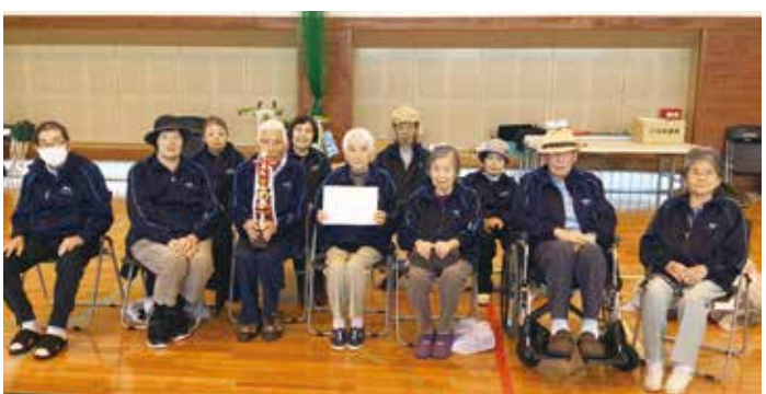
みんなで優勝を掴み取りました

昼食も弁当に刺身が入っており、皆さんからとても好評でした。その後は各施設趣向をこらした出し物を披露され歌や踊りを楽しまれました。久しぶりのゲーム大会でしたが、梅寿荘が優勝となり、参加された皆さんとても生き生きとした表情で「楽しかった」との嬉しい言葉も聞かれていました。次回もたくさんの方が競い合い、笑い合えるゲーム大会の開催となることを願っています。