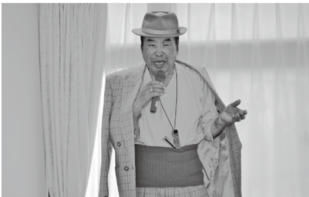
寅さんそっくりでした