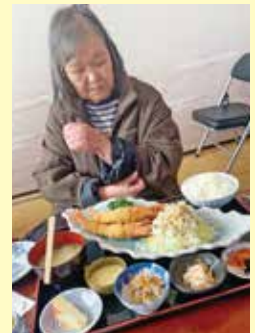
豪華な食事でした