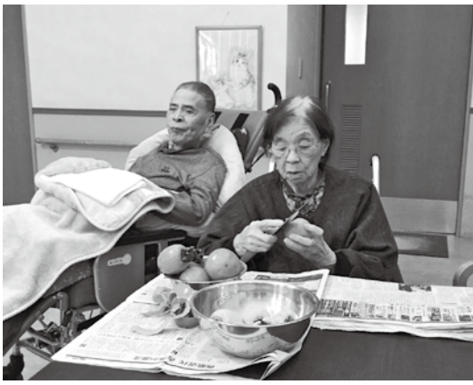
手慣れた包丁捌き

ユニットでは、今年も沢山の渋柿が届きました。そこで今回、この柿で「干し柿」をつくることになりました。お恥ずかしい話ですが、ユニットの職員は干し柿を作ったことがない職員も多く、どうしようかととりあえず包丁を持って柿をむいていると、見かねた利用者の方が「包丁をもってきて、私も手伝うから」と手際よく皮を剥かれていました。職員が「作り方を教えてくださいー！」とお願いすると、「剥いて、お湯につけて、干すだけ」とのこと。「昔はよく作っていたよ」と教えてくださいました。おしゃべりをしながらも、皮をむく手際よさに驚いて見とれていました。「次はヒモを持ってきて」と色々教えてくださいなさり本当に感謝です。 柿には栄養がたっぷりですが、干し柿にすることで、さらにぎゅっと栄養が凝縮するそうです。お日様と秋風に揺られ甘くて美味しい干し柿ができますようにと願いながら、出来上がりが楽しみです。