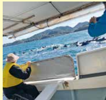
イルカにも出会えました

などのごちそうが並び美味しかったとの感想をいただきました。他の班に参加された利用者の方とても楽しまれたようで、「また行きたいなあ」「今度は違うところに行きたい」との声が多く聞かれました。今後とも定期的にこのような支援を実施することで、少しでも利用者の皆さんの楽しみとなり、日々の生活がより良いものとなるよう取り組んでいきたいと思えます。