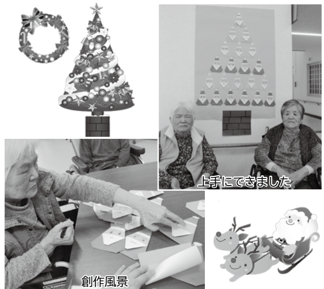
上手にできました

今後も、少しでも季節を感じられる行事や活動を行って、利用者の方に喜んでいただけるよう取り組んでいきたいと思います。